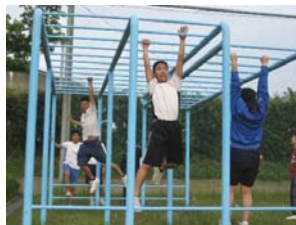
サーキットトレーニング